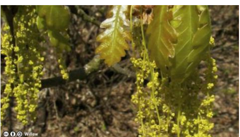
Fleurs de chêne