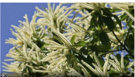
Fleurs de châtaigner