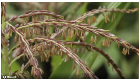
Fleurs mâles de maïs