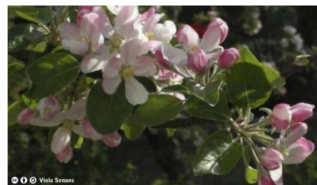
Fleurs de pommier