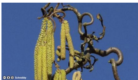
Fleurs mâles de noisetier