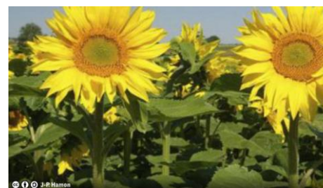
Fleurs de tournesol