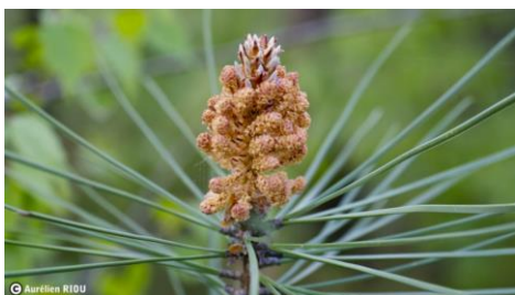
Fleurs mâles de pin