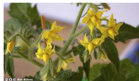
Fleurs de tomate