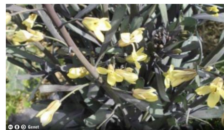
Fleurs de chou rouge